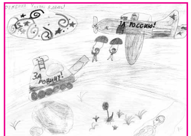
Поздравление ветеранам-фронтовикам. Ульяна ЕРЕМЕНКО. 8 лет.