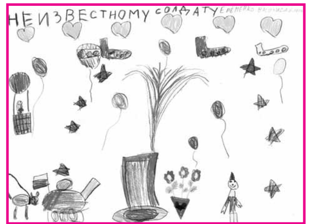
День Победы. Василиса ЕРЕМЕНКО. 5 лет.