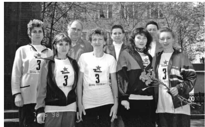
Начало 2000-х годов. Команда цеха на эстафете в честь Дня Победы.