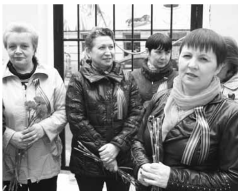
У мемориала накануне Дня Победы.