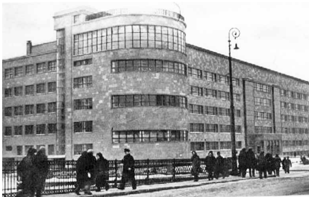
Здание Политехнического института кожевенной промышленности в стиле конструктивизма было построено на набережной в Садовниках к открытию вуза в первую пятилетку.

«Спустя две недели технорук А.А. Назаров доложил парткому, что оборудование, предназначенное для выполнения спецзаказа, установлено».