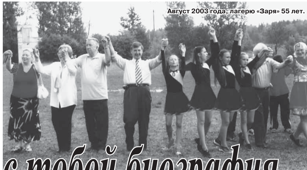
Август 2003 года, лагерь «Заря» 55 лет.