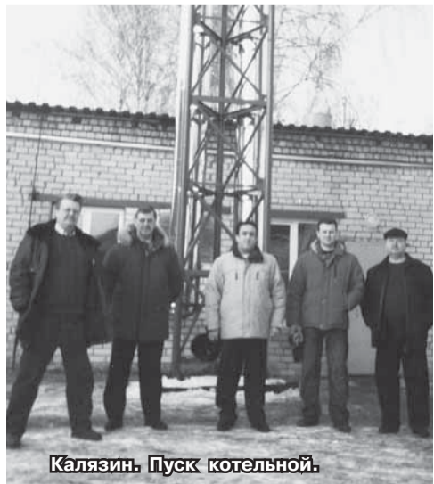
Калязин. Пуск котельной.