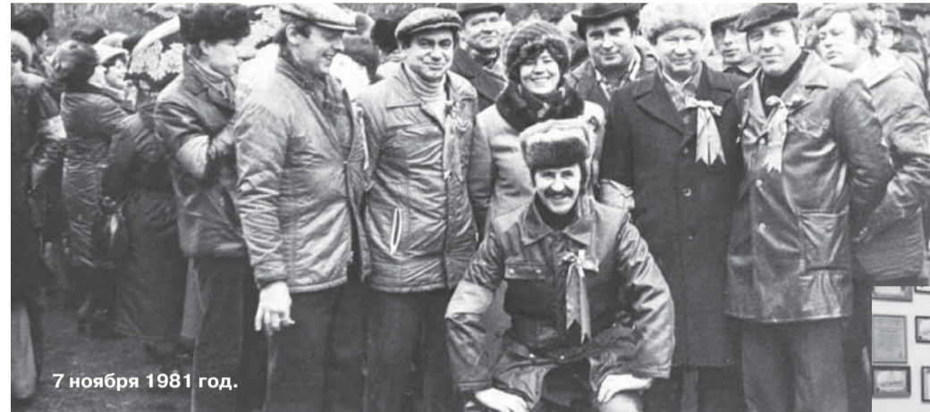
7 ноября 1981 год.

сам - собственными руками - мог работать электромонтером, слесарем-монтажником, получив эти навыки на практике еще студентом техникума и впоследствии совершенствуя их и оттачивая везде, где приходилось ему трудиться. А приходилось много где. После техникума в 21 год он был направлен на север западной Сибири - в Тюменскую область, где недавно началось освоение месторождения газа «Медвежье». Это была тогда знаменитая на всю страну стройка народного хозяйства. Вот с какими, овеянными романтикой, местами было связано